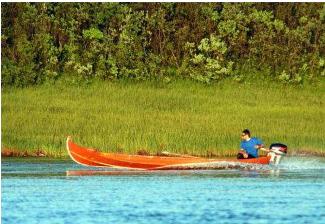
Катер для ловли сёмги на реке Тана.

По мнению Европейской Комиссии, нежелательно сохранять имеющуюся ситуацию, когда во многих семужьих реках Финмарка численность популяции сёмги находится на очень низком уровне.