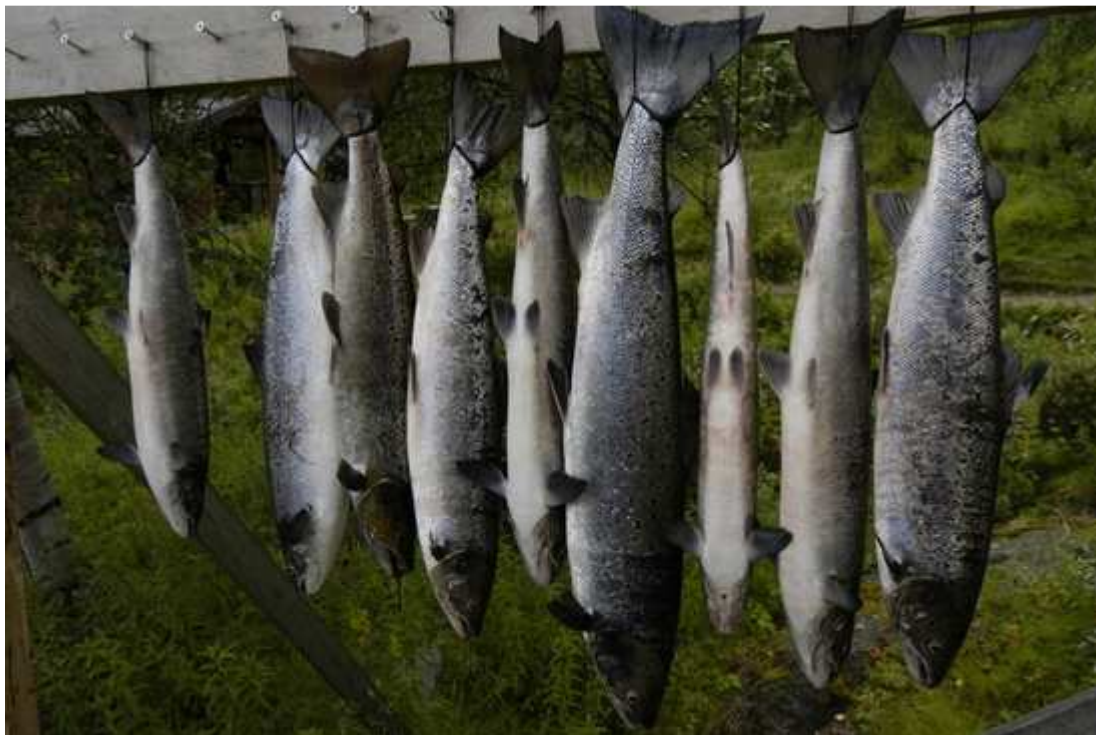
Улов дикой сёмги на реке Нейден.

«Мы вновь призываем Норвегию к сокращению перехватывающего рыболовства на смешанном запасе и принятию более жестких ограничительных мер, чем те, которые в настоящее время содержатся в предложениях Директората по охране окружающей среды», - завершает письмо В.С.Чиклиненков.